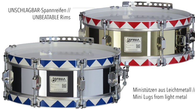
UNSCHLAGBAR-Spannreifen // UNBEATABLE Rims

Detaillierte Informationen finden Sie unter www.lefima.de